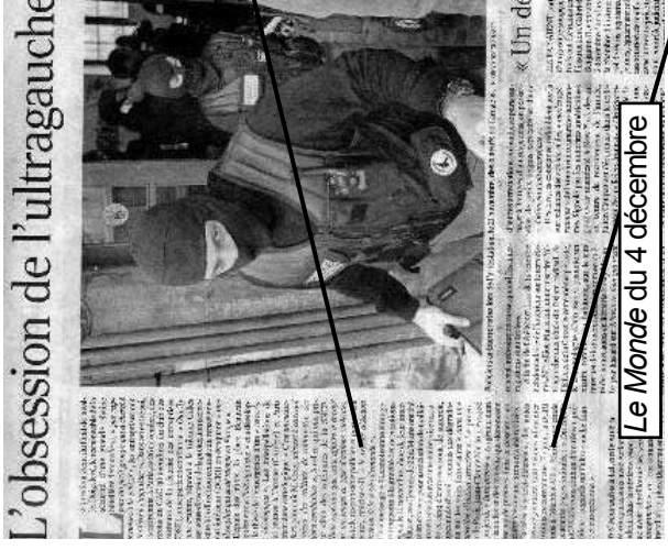
Le Monde du 4 décembre

L'AMT apparaît ainsi comme la pierre angulaire d'une technique de gouvernement basée sur l'antiterrorisme, dans laquelle un arsenal de lois d'exceptions et de procédures dérogatoires est toujours prêt à être mis en place pour légaliser les pratiques les plus arbitraires.