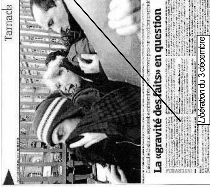
Libération du 3 décembre